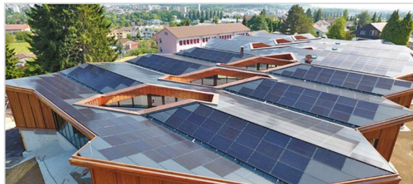
Gewerbehalle, Krankenhaus, Mehrfamilienhaus, Schulgebäude